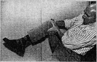
KRISTIAN BISSUTI ©